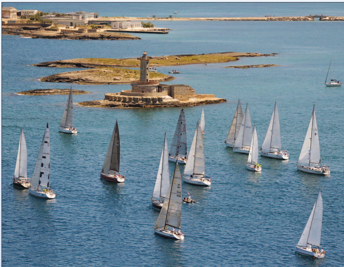
La partenza dell'edizione 2012 della regata

CONTO ALLA ROVESCIA PER LA XXVIII REGATA VELICA BRINDISI-CORFU'